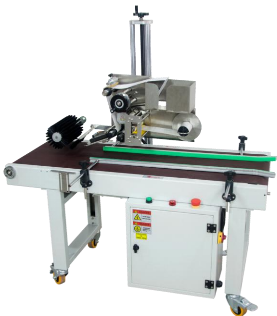
自动快递贴单机配置滚刷图